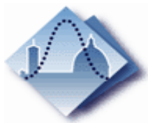
Dipartimento di Statistica