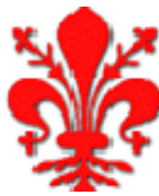
Comune di Firenze