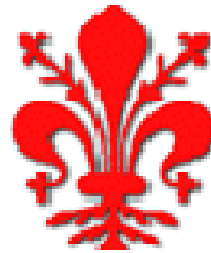
Comune di Firenze