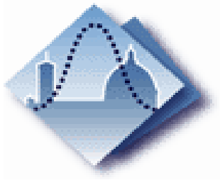
Dipartimento di Statistica